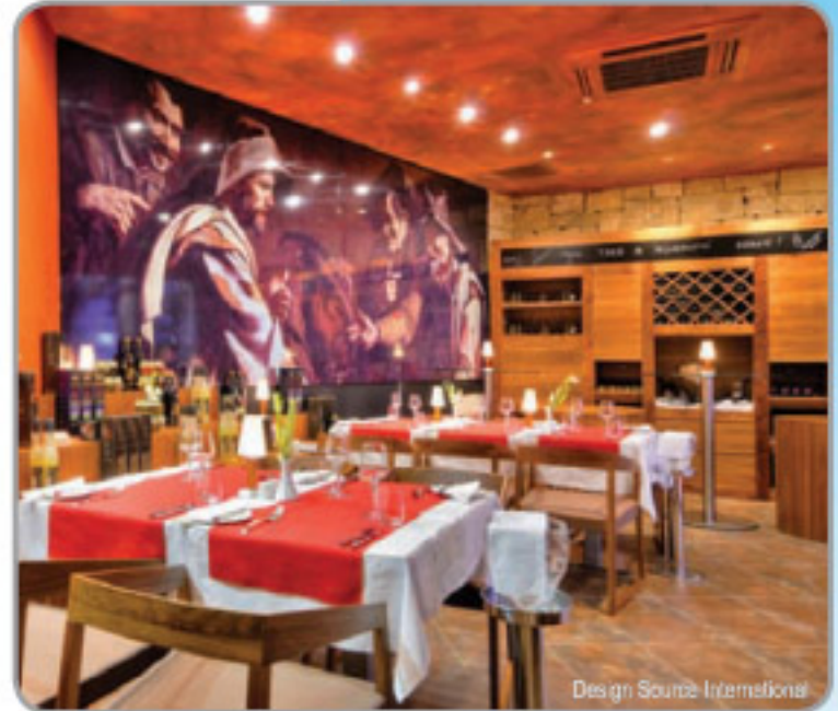
Design Source International

تقدم S.A.W. عروضاً لا حدود لها مراعية منذ البداية وحتى النهاية كافة احتياجات العميل.